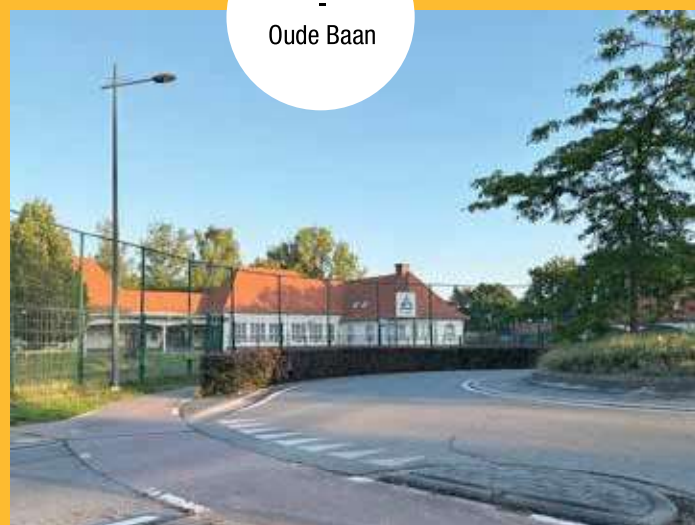
De Triangel - Oude Baan