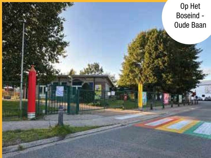
Op Het Boseind - Oude Baan

Deze schoolroutes en -omgevingen worden drukker en risicovoller.