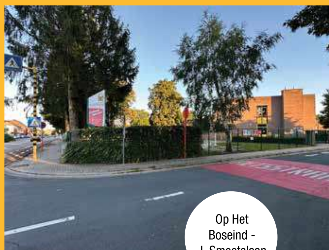
Op Het Boseind - J. Smeetslaan