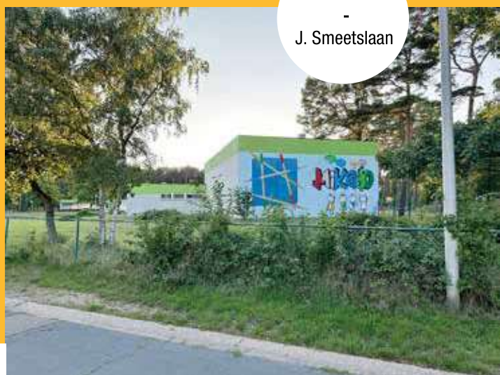
Mikado - J. Smeetslaan

Deze schoolroutes en -omgevingen worden drukker en risicovoller.