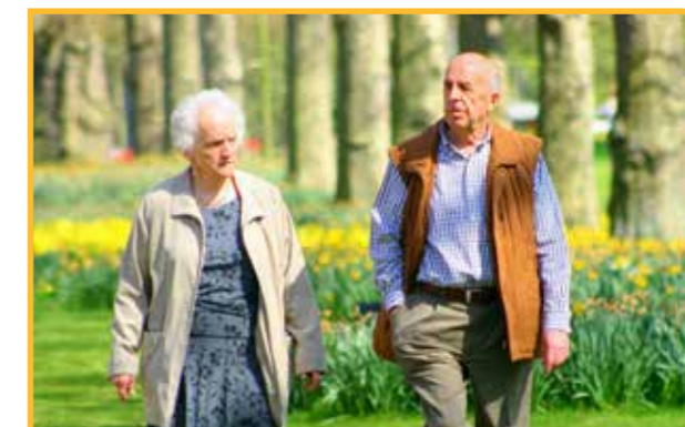
In het gemeentebestuur zorgt de N-VA er mee voor dat u van een mooie oude dag kan genieten, ondanks een slinkend budgettair kader.

Naast deze drie grote investeringen rond zorgcentra,