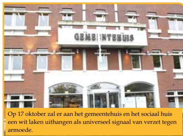
Op 17 oktober zal er aan het gemeentehuis en het sociaal huis een wit laken uithangen als universeel signaal van verzet tegen armoede.

Er is nog veel werk aan de winkel, maar Maasmechelen heeft de ambitie om de armoede terug te dringen. Onze middelen efficiënt beheren, is daarbij van cruciaal belang.