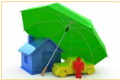
De gemeente bespaart 60 000 euro door absurde verzekeringspolissen aan te passen of te schrappen.

Onder impuls van de financiëschep en de OCMW-voorzitter heeft Maasmechelen haar verzekeringsbeleid drastisch herzien. Dat was nodig, omdat er onder het voormalig beleid veel geld verspild werd aan absurde verzekeringspolissen.