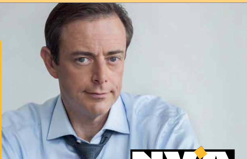
Bart De Wever Algemeen voorzitter N-VA

Op 14 oktober stemde heel Vlaanderen krachtig voor verandering. De N-VA haalde dan ook een knap resultaat. Zo komt er verandering in de Dorpsstraat. Blijft nu nog de Wetstraat. Want CD&V, sp.a en Open Vld zijn in de regering-Di Rupo echt niet goed bezig. Dat merkt u aan zowat alles. De N-VA zet uw vraag naar verandering daarom nu al centraal op de verkiezings-agenda van 2014.