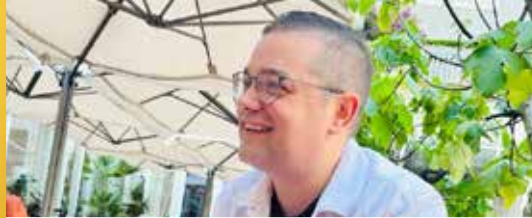
“De Maasmechelaar moet opnieuw centraal staan” (p. 2)