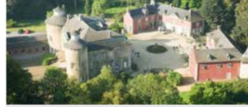
Aankoop kasteeldomein Leut p. 3