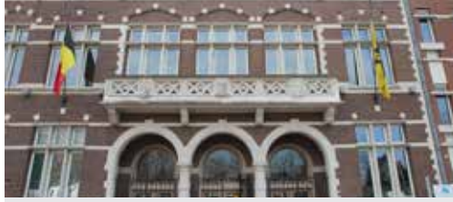
Gemeentelijke rekening op orde p. 2